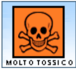
Molto tossico (T+)

Classificazione per gli effetti tossicologici, ecotossicologici e fisico-chimici