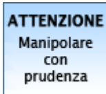
Non classificato m.c.p. (--)