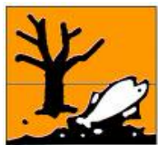
Pericoloso per l'ambiente (N)